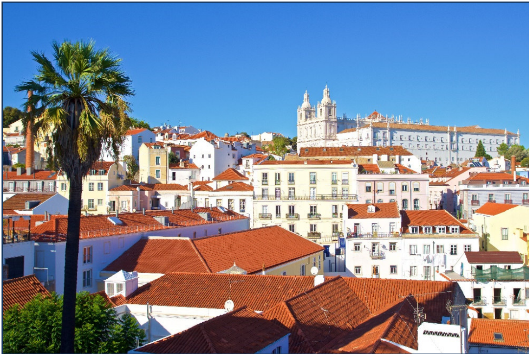
Lissabon - Skyline

Lissabon, am Schnittpunkt der maurischen und europäischen Kultur gelegen, ist eine der quirligsten und facettenreichsten Städte der Welt. Freuen Sie sich auf stimmungsvolle Eindrücke und Erlebnisse in der Metropole am Tejo, einer Stadt voll südländischer Lebensfreude, aber auch Heimat des im Fado besungenen Weltschmerzes. Strenge Romanik, manuelinische Gotik und bunte Azulejos begegnen dem Reisenden. Sie besuchen die einst maurisch-jüdische Altstadt Alfama mit ihrem Labyrinth der Gassen, das grandiose Hieronymus-Kloster in Belém und das eindrucksvolle Rokoschloss Queluz . Ein Ausflug führt in den entzückenden Ort Sintra und zur Küste von Estoril .