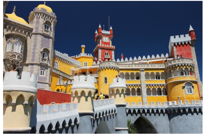
Sintra – Palacio Nacional da Pena

Am späteren Nachmittag bleibt noch etwas Zeit zur freien Verfügung.