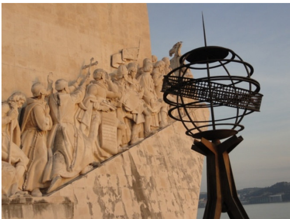
Lissabon - Seefahrerdenkmal