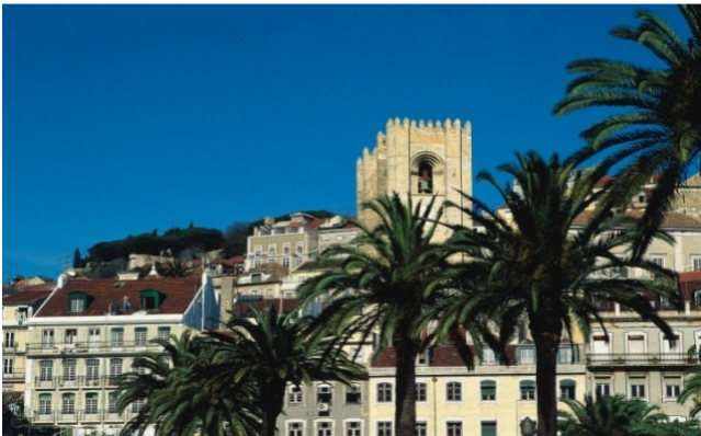
Lisboa Cathedral

Gegen 15:00 h starten Sie zu einer Panoramastadtrundfahrt mit dem Bus über die Brücke 25 de Abril zur Christus-Statue Cristo Rei am südlichen Tejo-Ufer. Lissabon ist eine der schönsten Hauptstädte der Welt. So heißt es denn auch in einem portugiesischen Sprichwort: „Wer Lissabon nicht gesehen hat, hat niemals etwas Schönes gesehen“.